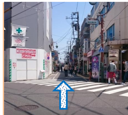
③梅ヶ丘商店街を直進します。