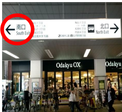
①梅ヶ丘駅南口にでます。