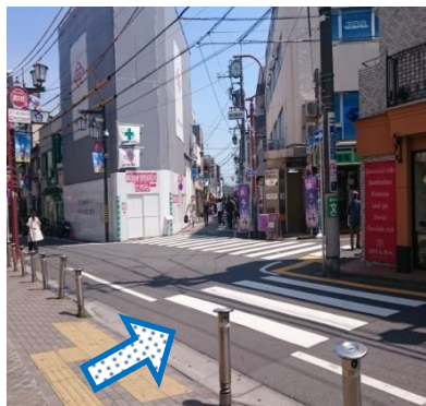
②左側へ進み、 一つ目の横断歩道を渡ります。