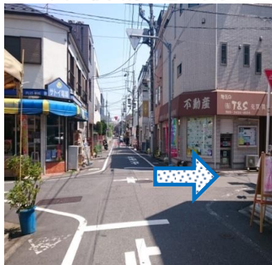
⑤一つ目の十字路を 右に曲がります。