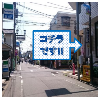
⑧左側にベンリーが見えてきたら 向かい側がBurnista梅ヶ丘です!!