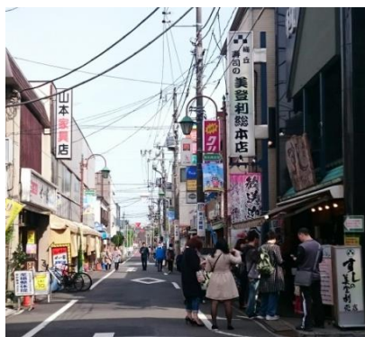
④右側に美登利寿司、左側に ココカラファインを通り過ぎます。