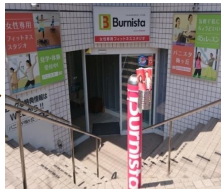
⑨正面の入口からお入りください。