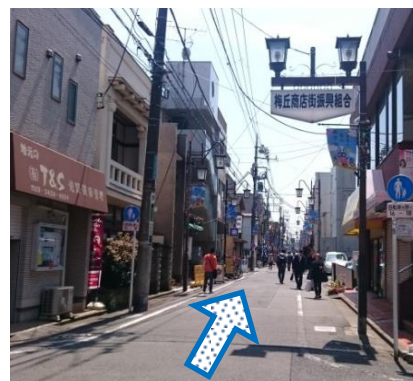
⑥梅ヶ丘商店街振興組合の 街灯沿いに進みます。